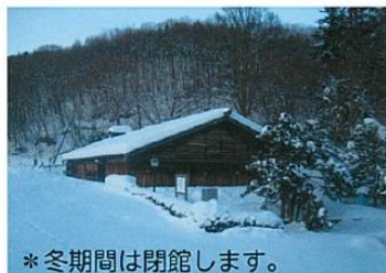
*冬期間は閉館します。